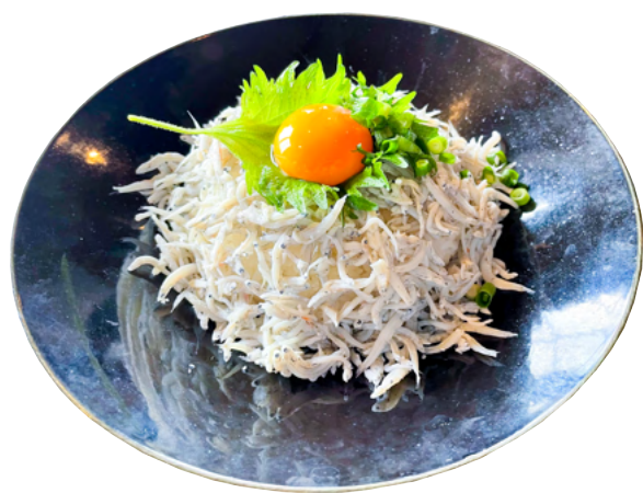
Seafood shirasu bowl 釜揚げしらす丼