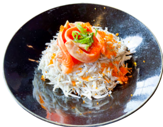
Shirasu & Salmon bowl しらすとサーモンの海鮮丼